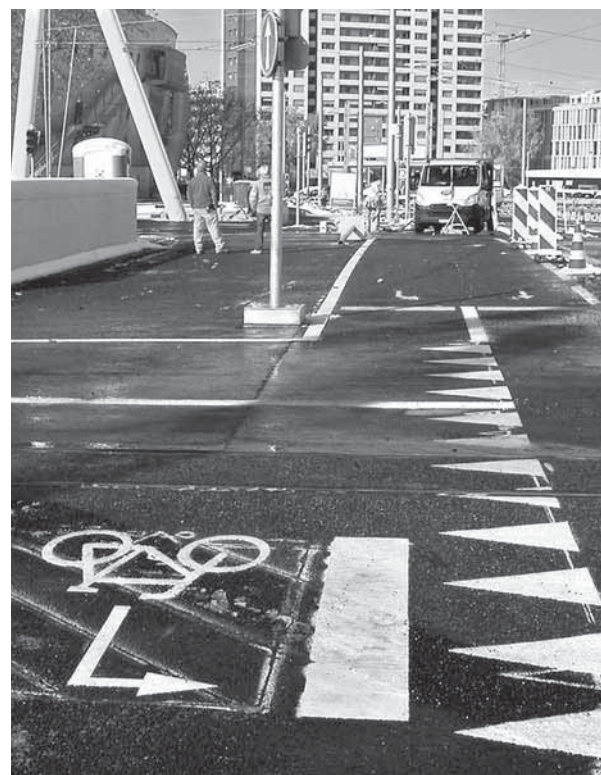
Einspurstrecke: Linksabbiegen soll nur indirekt möglich sein

Auch das Linksabbiegen ist nur indirekt möglich, in der Verhandlung hiess es noch, direktes Linksabbiegen sei bei wenig Verkehr möglich, wenn auch nicht attraktiv. Nun soll es sogar verboten sein, was für